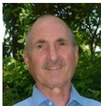
Harry Euler Öffentlichkeitsarbeit

Der Seniorenbeirat ist die gewählte Interessenvertretung aller Bürgerinnen und Bürger der Stadt Neu-Anspach, die das 60. Lebensjahr vollendet haben.